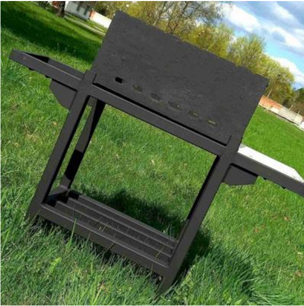
Мангал чугунный 260*560*330